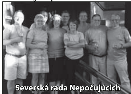
Severská rada Nepočujúcich

V stredu večer (18.7.) sme boli pozvaní na párty Vikingov na pôde budovy Španielskej národnej konfederácie Nepočujúcich. Pozvala nás Severská rada Nepočujúcich – Dánsko, Fínsko, Faerské ostrovy, Island, Nórsko a Švédsko. Táto Severská rada oslávila 100. výročie založenia rady. Severská rada Nepočujúcich je organizácia, ktorá pracuje s cieľom za rovnosť pre Nepočujúcich. Reprezentácia krajín – každá organizácia má dvoch reprezentantov, stretávajú sa 2-x do roka. Granty na cestovanie a stretnutia dostávajú od Severskej spoločnosti postihnutých. Úlohy Severskej rady: