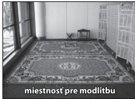
miestnosť pre modlitbu

– divadlo a diskotéka. Pre účastníkov bola pripravená aj každodenná tlač – noviny vo formáte A3, na nich boli napísané udalosti z kongresu. Noviny na 1. strane boli písané v angličtine a na 2. strane v španielčine.