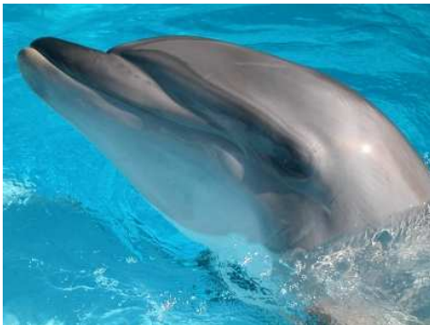
Obr. č. 4: Delfín zastúpený fotografiou.