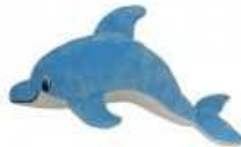
Obr. č. 5: Delfín zastúpený predmetom.

Glovňa (2008) tvrdil, že znakový jazyk je navyše „strešným pojmom pre všetky semiotické 1 systémy, ktorých základná jednotka má znakový charakter. Tak je náš bežný hovorený jazyk znakový jazyk, takisto písaná podoba jazyka, ba dokonca aj posunkový jazyk je znakový jazyk. V posunkovom jazyku sa stáva základným semiotickým a komunikačným prvkom posunok: ten nadobúda znakovú funkciu".