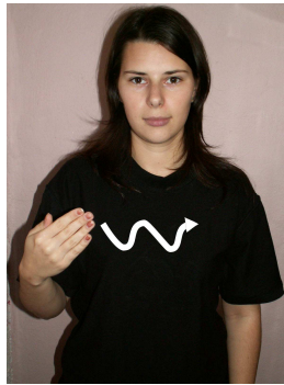
Obr. č. 2: Delfín zastúpený posunkom.